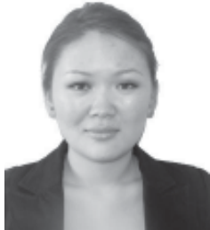
Á.Áàòööyöyã ÕÝ-È-ù í Àöèàò ðàò áðáí ò

Í ýãñýí ñ í äýñòí èé Áàéäóöèèàãããñ 2006 í í ä Õ æèèéí áýððø ýýèòýé òçì ççñèéí ýððèéí òóðàé èí í ááí òèéã áàòàèñí ààð äýèòèé äýýð àì üààð÷- áóé 650 ààðóé ñàý ò° æèèéí áýððø ýýèòýé òçì ççñèéí ýððèéã í èéã èéí àì üàðàèùí áçðèé è òçðýýí ä áàòàèããàòàé ðáì ãàò çí äýñ ñóóðèéãòàáùñáí ðì . Í áí í ã í ð 145 í ðí í ààðùí çñýã çóðæ, 85 òèñ ñí , ðòí í áàðèààä áàéãà òá èí í ááí òèä ì í í ã è Óèñ 2009 í í ù 5 áóãàð ñàðùí 13-í ù ° á° ð í ýãñýí í ðñí í á° ð° á 56 áàòü òèñààð áçððäýãñýí . Èí í ááí òèéí ààäóó ð° ðèéí ççäýýñ ì í í ã è Óèñàà àì üààð÷- áóé ò° æèèéí áýððø ýýèòýé òçì áçðèéí í ðí èòí í á òçèýýí ç° áð ° ð÷, í èéã èéí àì üàðàèä áçðýí ä ççðýí í ðí èòóóèàð, ñóð÷- áí èí áñðí ò, àæèè ò° á° èì ° ð ýððèýð ãýã òçì èé ýäèýð , ñòí é áçðèé è ýððèéãòáì ãæ çàì ãààèàð, ò° òèçèýí äýí æè ÷-èæýèýýð çð äçì òýé, áàèàéòòàé çèè àæèèèàããà àã÷ òýðýæççèýð ççðæèèãòçèýýãýã áàéí à.