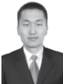
Á.Áí èî ðñàéõáí ÕÝ-È-ù í ðáõ àðáí ò

Õççõæéí òàèààððì ýáýýéýè òççýýðýä "ä° ð° ä äýõ çàñàæèè" äýæ í ýðèýääñýí òýäéýè ì ýáýýèèèéí¹ òýðýñýè ÷õõæ áàéð ñóóðèéä ýçýèäýä. Äýðäýý òççõæèéä ì ýáýýèèèéí ýð ñóðàèææõýí ýýí ççýðýä òýäéýè ì ýáýýèèèéí òýðýñýèèéí òóäüä ýäðýä òáí àèàæä áàéð ð ààðàèàæäòáé. Ó-èð í ì ì ýáýýèèèéí òýðýñýèýð òàòàæäæáóé ì ýáýýéýè í ì òççõæèéá í èéäýí ä èäýäðòýé î ðí èõí ä- áèð , ýñáýè ýðð ýäéýä- áàéæáí èí òäçé, òçí äýðäýð ð ààðàèàæäçé äýñýí òóààð ì ° ÷èä ò° ñ° èèèéááèé áí èä ò áí èí ì æòí é ð ì .