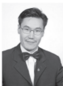
Ц.Цогт Нийслэлийн Захиргааны хэргийн шүүхийн шүүгч