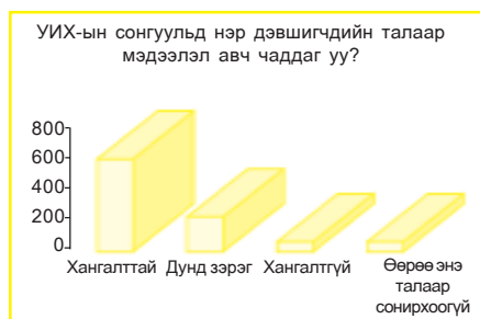
“Сонгох, сонгогдох эрхийн хэрэгжилтийн төлөв байдал” судалгаа НСХ 2004 он.